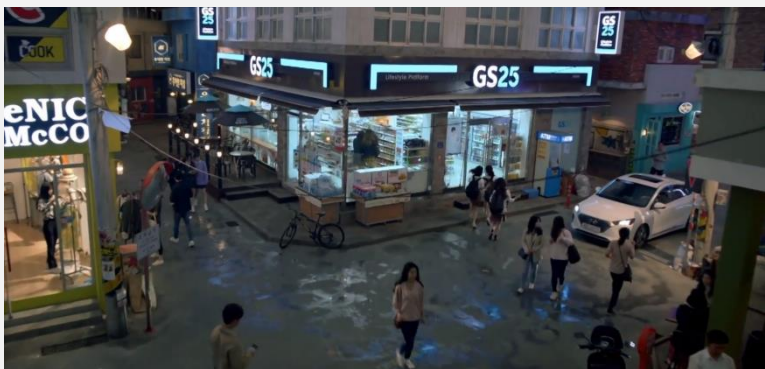
프랜차이즈 매장방문 에피소드 <SBS 편의점 셋별이> - GS25

드라마 내 제품 사용/대사/식음/착장 또는 매장방문 통한 브랜딩 주,조연 배우를 활용해 '에피소드' 형태로 자연스러운 브랜드 및 제품 노출