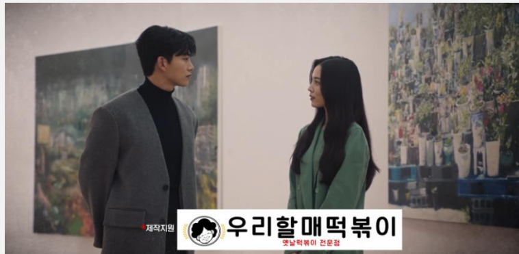
<KBS 가슴이 뚫다> - 우리할매떡볶이