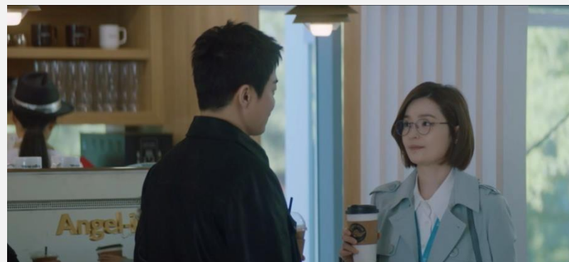
제품 식음 에피소드 <tvN 슬기로운 의사생활> - 엔젤리너스