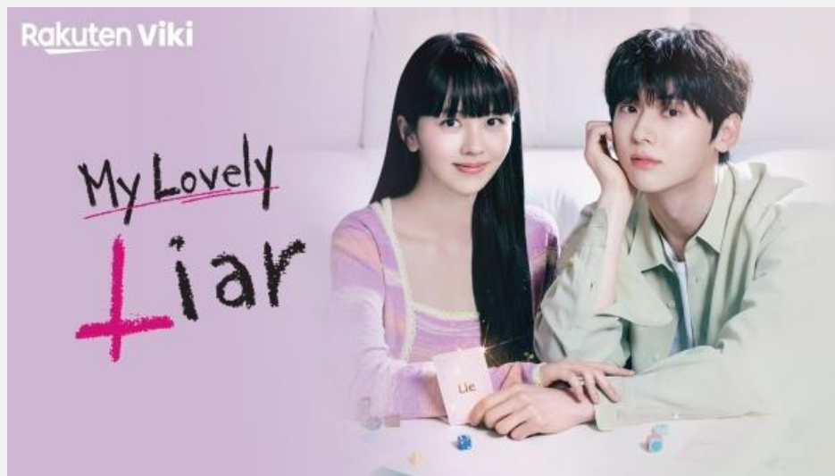
tvN <소용없어 거짓말> 미국, 캐나다, 프랑스 등 해외 127개국 1위