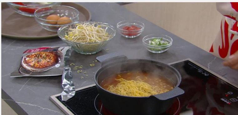
제품 식음 에피소드 <KBS2 효심이네 각자도생> - 더미식