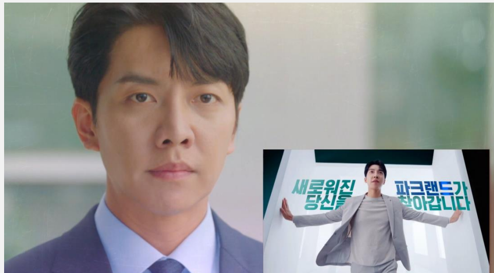
<KBS 법대로 사랑하라> - 판크랜드