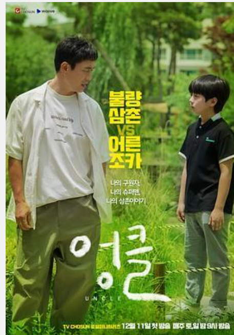
TV CHOSUN <영글> 최고 시청률 9.3%