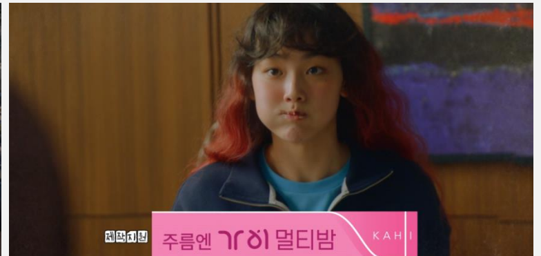
<KBS 미남당> - 가히