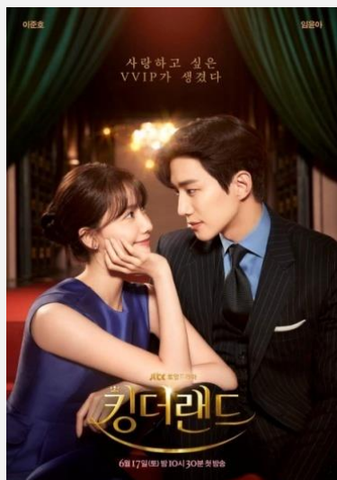
JTBC 최고 시청률 13.8% 넷플릭스 8주 연속 글로벌 TOP10

K-드라마의 대표 장르이자 흥행 보증수표인 로맨틱 코미디 장르. 기존의 문법에 그간 보지 못 했던 DNA라는 새로운 소재를 가미한 익숙하면서도 새로운 맛의 작품 또한, 기존 TV조선 탄탄한 시청층인 4060 뿐만 아니라 젊은 세대까지 유입 가능해 폭넓은 시청층과 화제성 예상