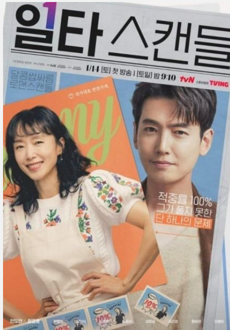
tvN <일타스캔들> 최고 시청률 17%

등장인물들의 연애사 외에도 가족들의 이야기가 어우러져 무겁지 않으면서도 서로 상처를 치유해가는 힐링 드라마로 가볍게 볼 수 있는 작품