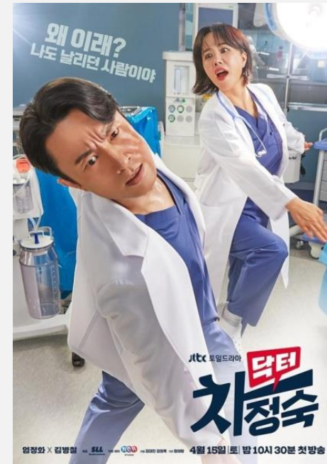
JTBC <닥터차정숙> 최고 시청률 18.5%